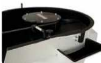
ENTRADA DE PIEZAS