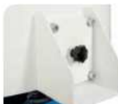
COMPUERTA DE VACIADO