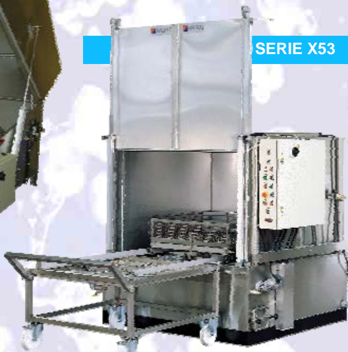
L-160 L-190 L-210