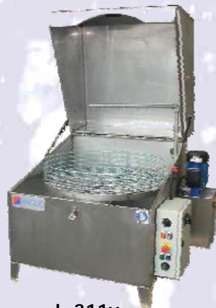
L-311v L-321v L-331v