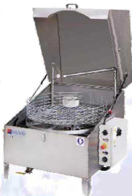
L-101 L102 L-122